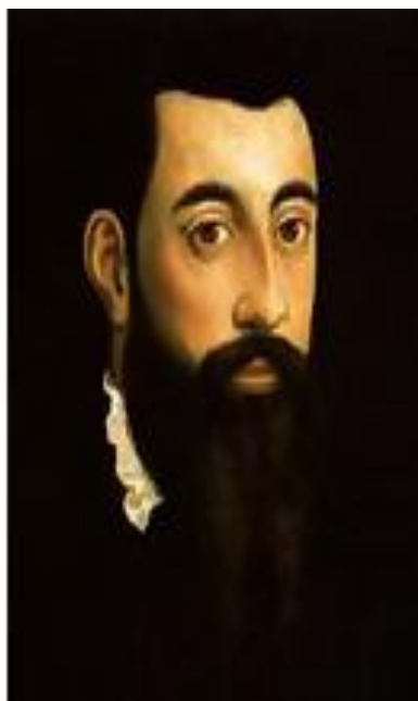
FERNANDO DE HERRERA