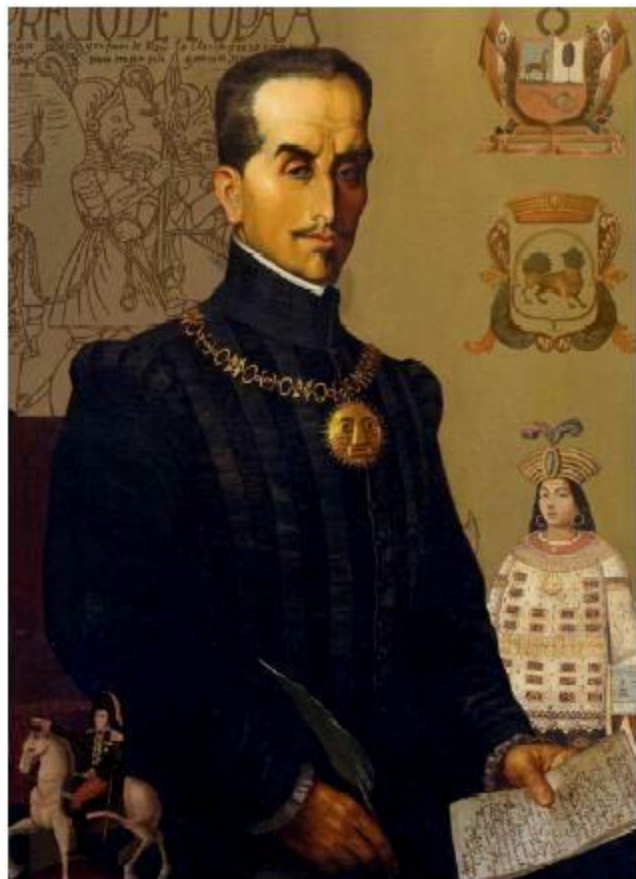
FRAY LUÍS DE LEÓN